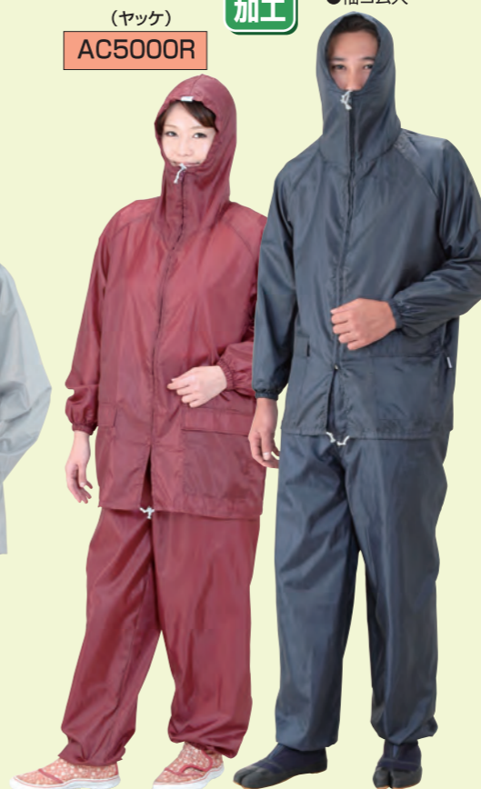
(パンツ) AC2030R (パンツ) AC2030C