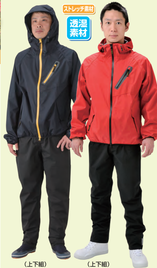
(上下組) AC820NV (上下組) AC820RD