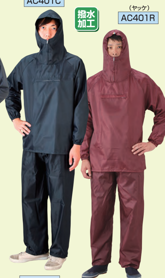
(ズボン) AC302C (ズボン) AC302R