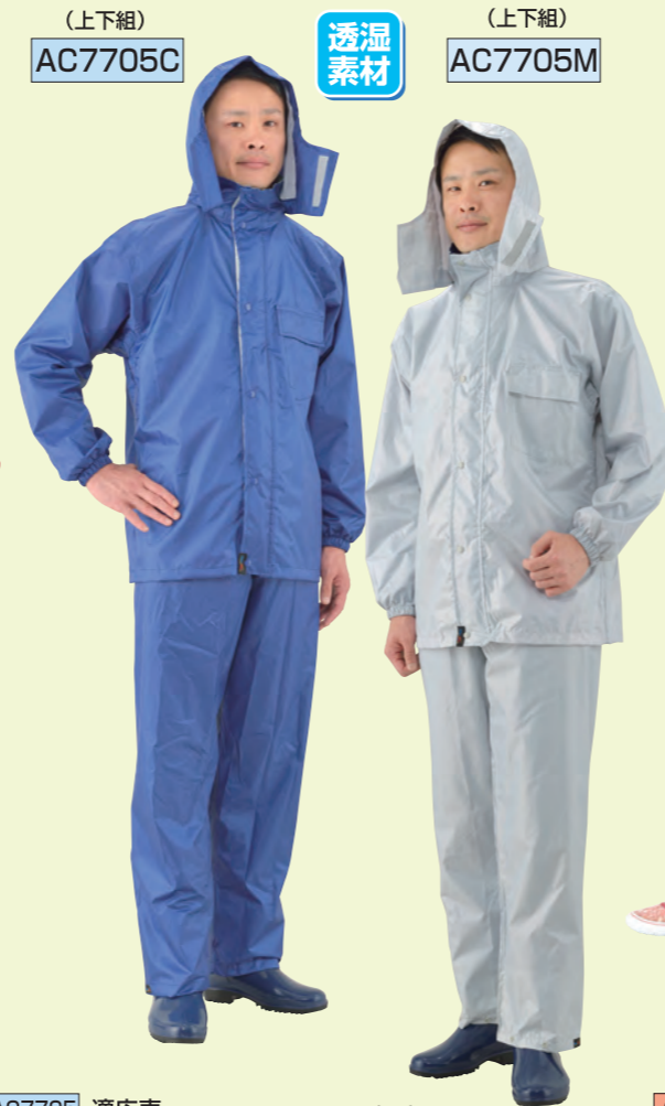
(上下組) AC7705C (上下組) AC7705M