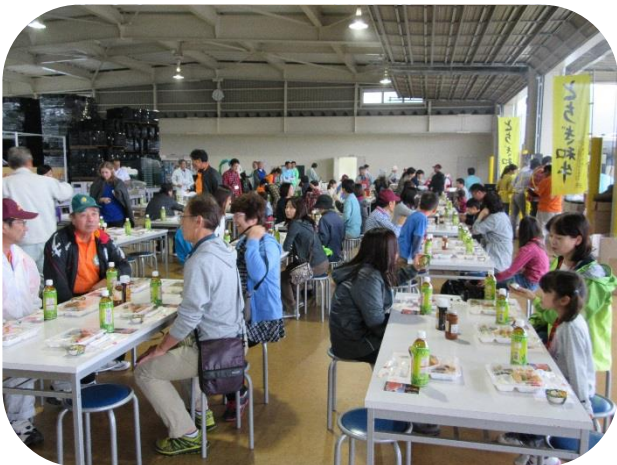
普段は梨やトマトの選果を行っている選果場で、みんなで昼食を頂きます。