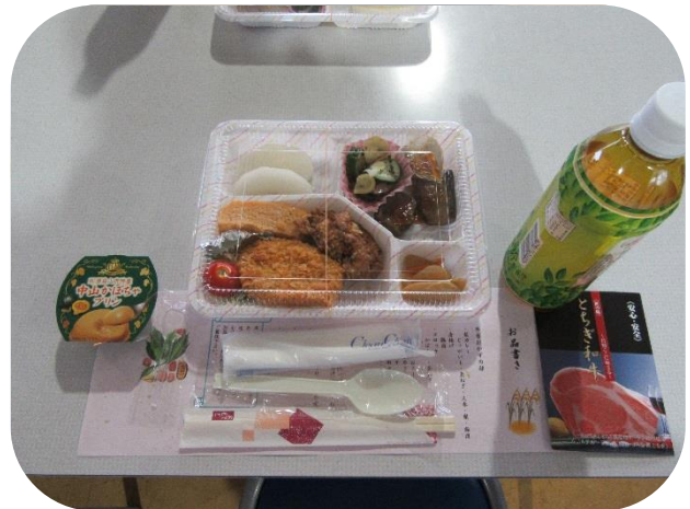
JA なす南女性部の方々が腕によりをかけて作ってくださったお弁当です。どのおかずもとてもおいしかったです。