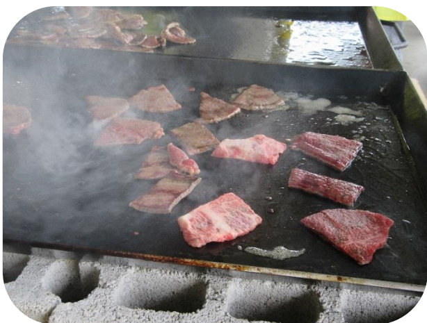
栃木のブランド牛『とちぎ和牛』のバーベキューです。いい匂いが辺りに漂い、食欲をそそります。