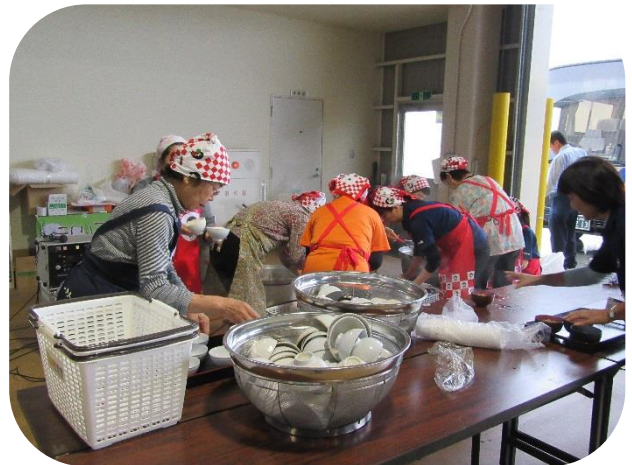
配膳をしてくださったのもJA なす南女性部の皆様でした。本当にありがとうございました！