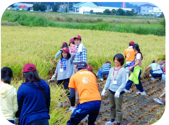
水稻請負部会の方々による指導で、刈るスピードが速くなっています。