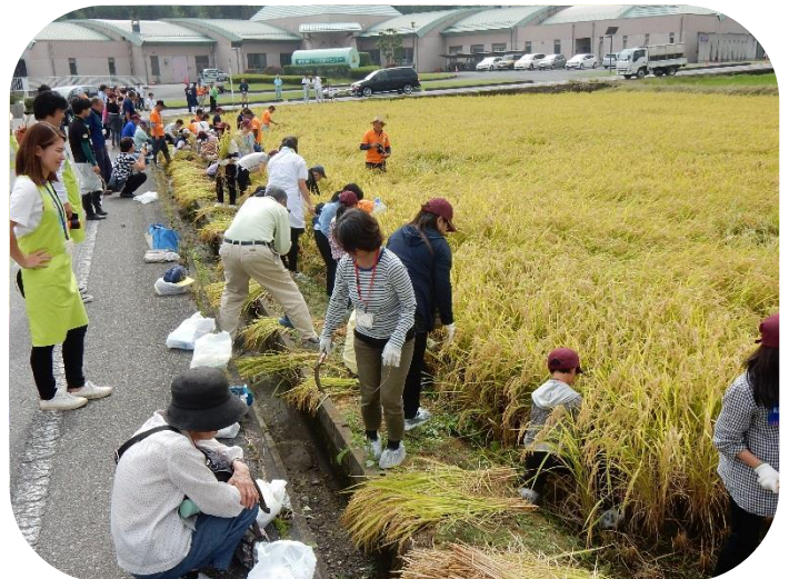
田んぼに入って稲刈りを開始しました。皆さん上手に刈っています。