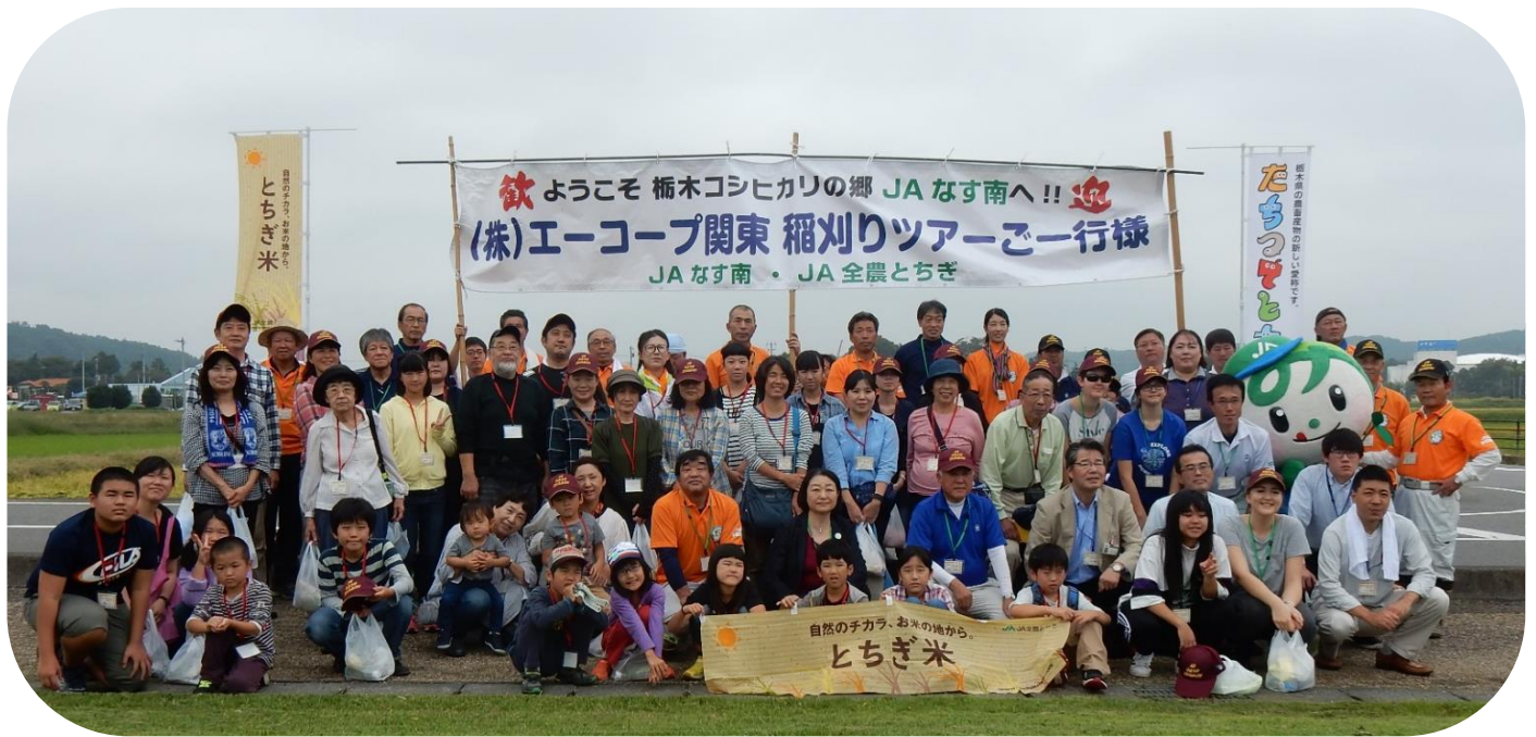
稲刈りの前に記念撮影をしました。皆さんとても良い笑顔です。