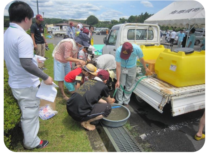
参加者の皆さんは泥で汚れた手足をきれいに洗い、昼食会場へ移動します。