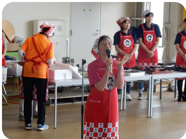
昼食の案内を JA なす南女性会の方からして頂きました。