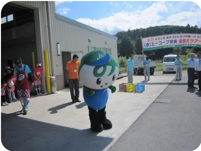
昼食会場でも『なすみん』がお出迎えしてくれました。