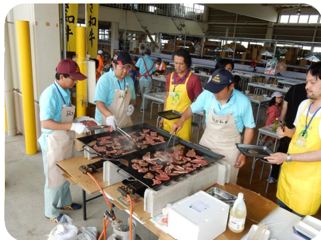
とちぎ和牛の焼肉。とてもやわらかくて、美味しいお肉です。