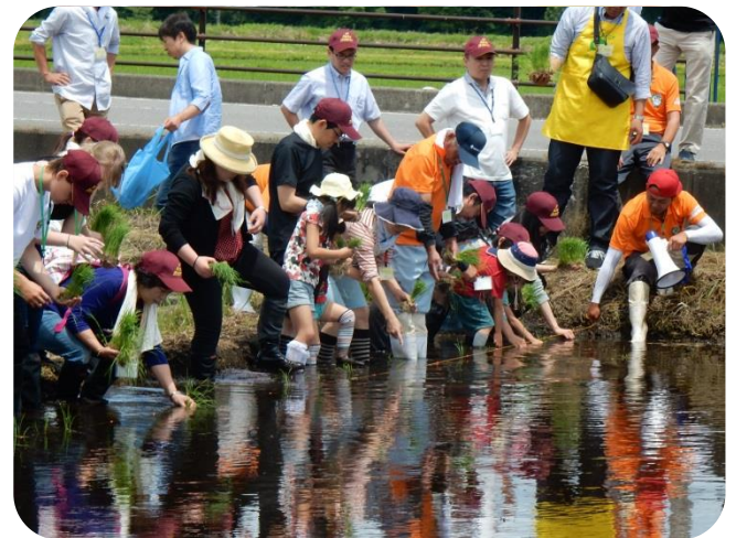
慣れない泥に悪戦苦闘しながら1つ1つ苗を植えています。