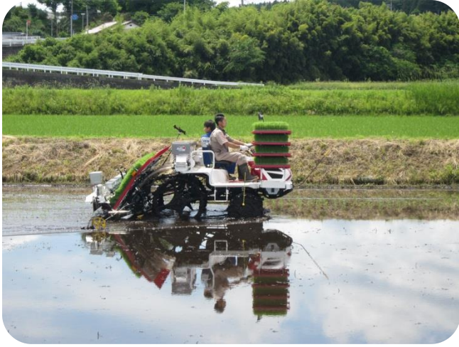
田植え機の登場です。残りの田んぼに苗を植えていきます。