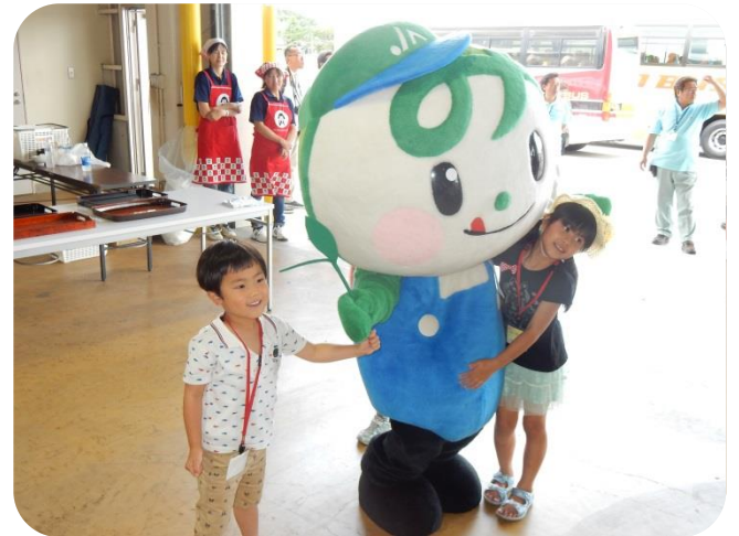
ここでも、参加者の子供達と記念撮影♪ みんな『なすみん』に会えてとても嬉しそう♡