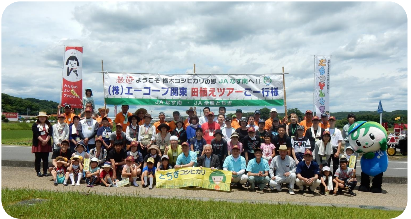
田植えの前に記念撮影！！みなさん素敵な笑顔ですね♪