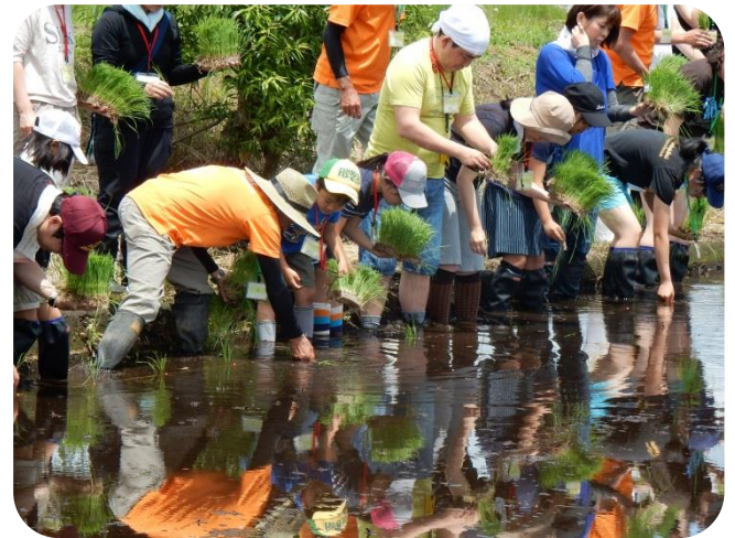
いよいよ田植えのスタートです。生産者の号令でみんなで1列になって田植えをします。