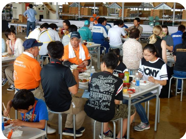
生産者の方々と一緒に昼食です。農家さんの体験談など貴重なお話しが沢山聞けました。