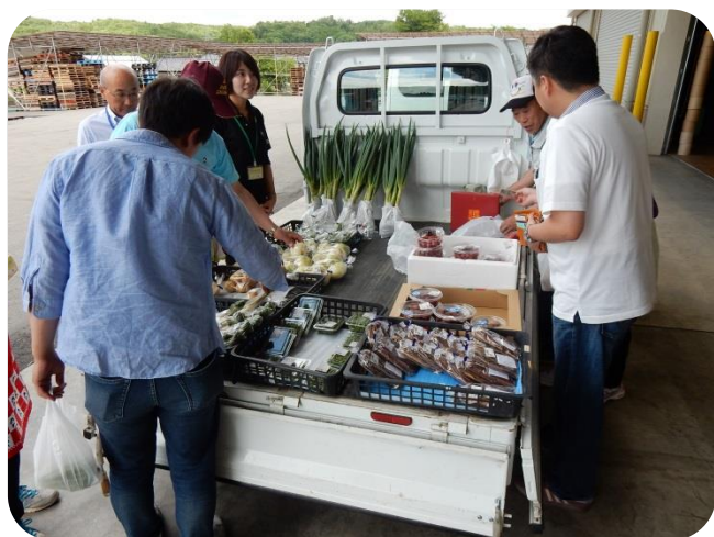
昼食会場の外では、生産者の方が地場野菜の直売をしていました。新鮮な野菜が並んでいます。

昼食後は名残おいしいですが、皆さんとお別れして、元気あっぷ村へ移動です。ここでは温泉に入り汗を流してさっぱり♪群馬から参加の方々ともここで別れです。帰路は、渋滞に合う事もなく順調に新宿へ着きました。今年も皆さんのおかげで、ケガや事故等もなく無事田植えツアーを終える事ができました。今から秋の稔りが楽しみです。